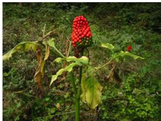
マムシ草の実 実のなる樹にも目を向けるといいですね