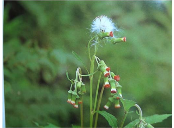
べにばなぼろぎく 休憩した建物の外側に咲く