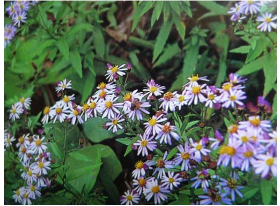
のこんぎく 駐車場の土手に咲いていました