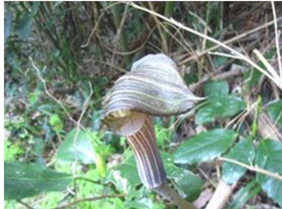
マムシ草の花 時期が違います