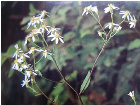
やましろぎく 山道に咲いていました